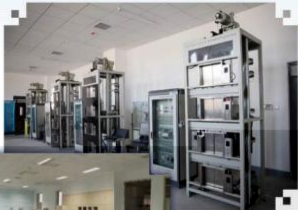
智能电梯安装调试 维护训练场所